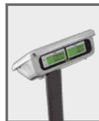
Doble display usuario cliente